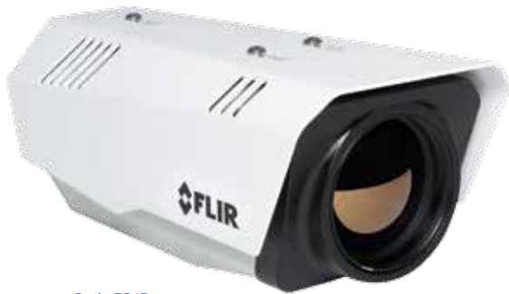
Serie FC ID