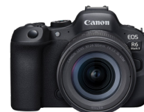
EOS R6 Mark II

La tua creatività ha tutto da guadagnare con la tecnologia full frame di questa fotocamera mirrorless leggera che consente di realizzare foto e video di qualità superiore. Ottieni un effetto bokeh migliore, angoli di visuale più ampi e una qualità d'immagine che ti lascerà a bocca aperta, anche in condizioni di scarsa illuminazione.