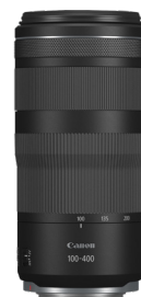
RF 100-400MM F5.6-8 IS USM

Un obiettivo piccolo, leggero e conveniente, con un'ampia apertura pari a f/1.8, ideale in condizioni di scarsa illuminazione e ottimo per un uso creativo della profondità di campo.