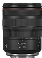
RF 24-105MM F4 L IS USM

Un obiettivo zoom versatile, che offre un equilibrio perfetto tra prestazioni, portabilità e qualità dell'immagine.