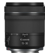
RF 15-30MM F4.5-6.3 IS STM

Progettato per garantire la massima discrezione, questo obiettivo RF compatto full frame per fotocamere EOS R, dotato di una lunghezza focale di 28 mm, un'ampia apertura f/2.8 e ottiche PMo, è ideale per fotografie di viaggio, ritratti di strada e vita quotidiana.