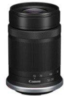
RF-S 10-18MM F4.5-6.3 IS STM